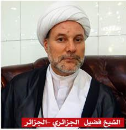
الشيخ فضيل الجزائري - الجزائر