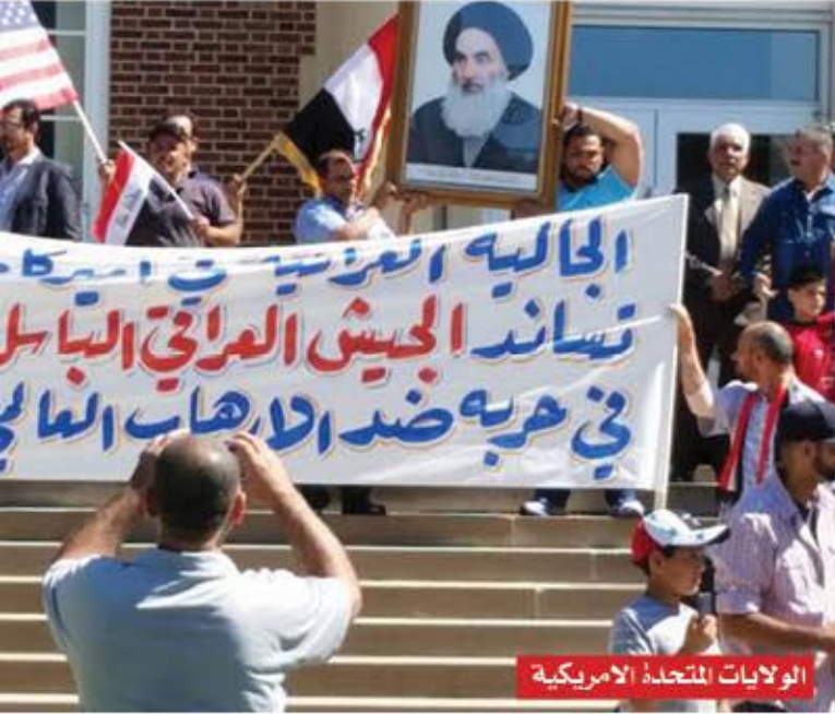
الولايات المتحدة الامريكية