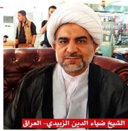
الشيخ ضياء الدين الزبيدي - العراق